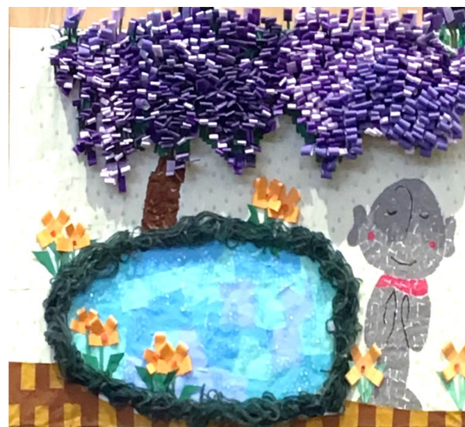
藤の花のちぎり絵